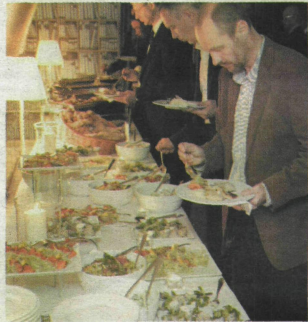
Kuchnia Amber Room